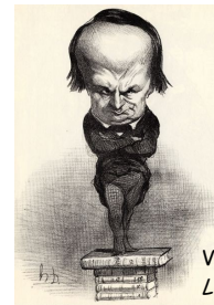
Victor Hugo Le Charivari (20 juillet 1849)

Son trait incisif et novateur s'attaque tour à tour au sujet politique et à la critique de la société bourgeoise. Il prit pour cible les travers et les ridicules bourgeois, les gens de finance, justice ou encore médecine.