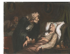
Le Malade imaginaire. Peinture.

Son trait incisif et novateur s'attaque tour à tour au sujet politique et à la critique de la société bourgeoise. Il prit pour cible les travers et les ridicules bourgeois, les gens de finance, justice ou encore médecine.